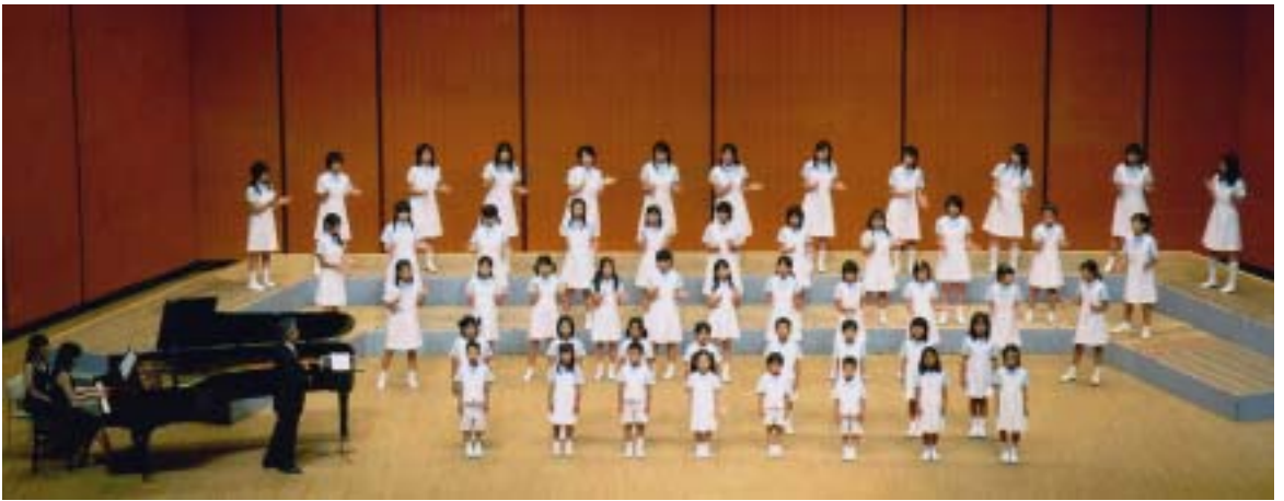
第 27 回こども合唱祭 2006 年 8 月