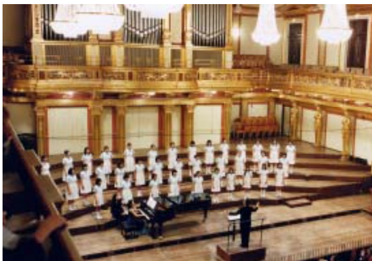
ウィーン楽友協会大ホール 日壊親善演奏旅行 世界一と言われるホールの音響。 天井裏には今もって謎とされている 仕掛けがあるという。 あの時の私達の歌声が... 残響が... 今も耳に残っています。 2002.3.25