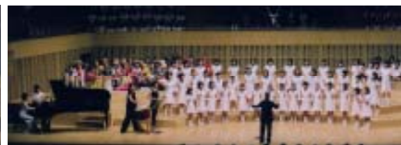
全日本ジュニアコーラス・フェスティバル <京都コンサートホール> 2005.7.31