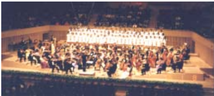
京都コンサートホール（大） 開館記念ニューイヤーコンサート 京都市交響楽団との共演 1996.1.8